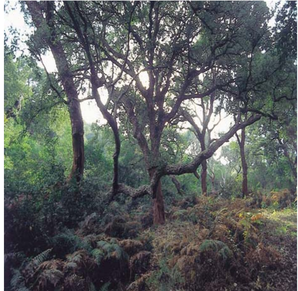
UN BOSQUE ES UN ECOSISTEMA CON MUCHAS ESPECIES DISTINTAS. ES, POR TANTO, MUY DIVERSO.

bajo debido a las condiciones tan duras que allí se dan. Por el contrario, en otros como las selvas el número de especies se cuenta por cientos de miles.