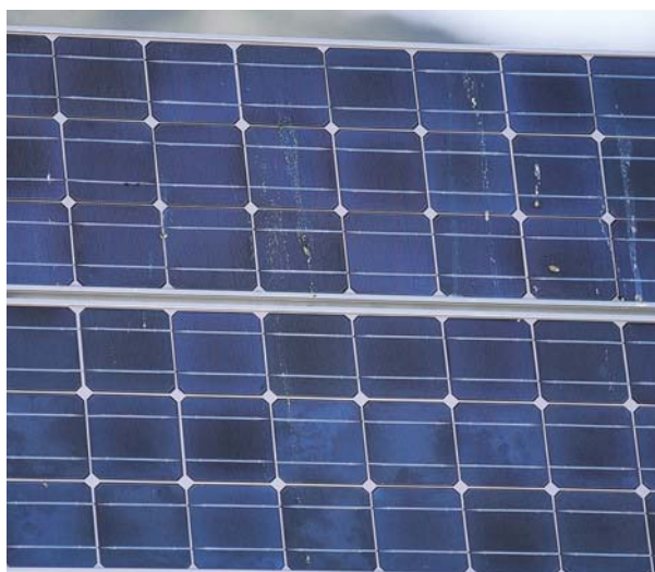
PANEL SOLAR; EL SOL ES OTRA FUENTE DE ENERGÍA RENOVABLE.

sería la utilización de artes de pesca selectivas, la realización de paradas biológicas que permitan la regeneración de los caladeros, los cultivos marinos y la acuicultura.