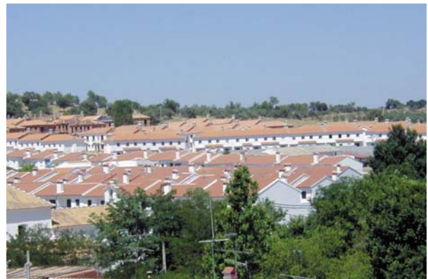
EL ENTORNO URBANO FORMA PARTE DEL MEDIO AMBIENTE.

El medio ambiente es el compendio de valores naturales, sociales y culturales existentes en un lugar y un momento determinado, que influyen en la vida material y psicológica del hombre y en el futuro de generaciones venideras.