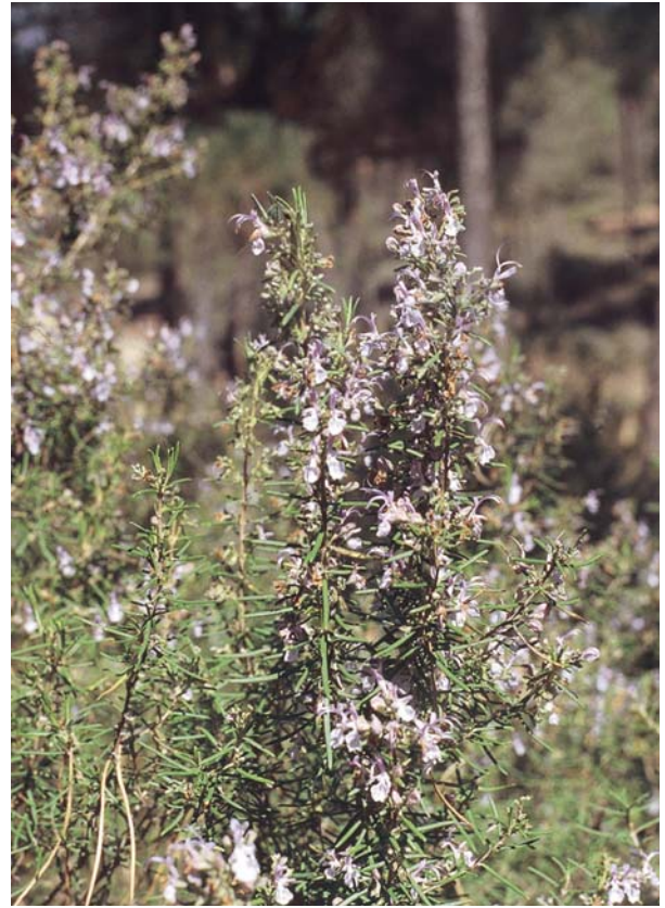
ELEMENTO DE FLORA.

Nos referiremos a la flora de un lugar como el conjunto de especies de plantas que allí viven.