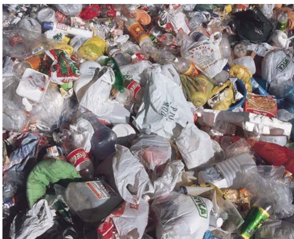
LAS BASURAS SON UNA FORMA DE CONTAMINACIÓN.

De todos los contaminantes , podíamos destacar los metales pesados, ya que son muy perjudiciales para los seres vivos y, además, son de los que poseen una mayor persistencia en el medio en el que se depositan.