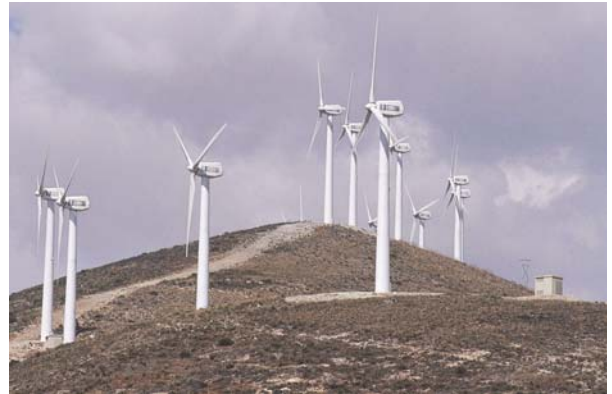
EL VIENTO ES UNA FUENTE DE ENERGÍA INAGOTABLE.

o el poder calorífico de la materia orgánica (biomasa).