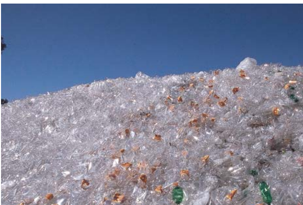
VIDRIO ALMACENADO PARA SU RECICLAJE.

En la energía renovable se emplea la fuerza del viento (eólica), del agua (hidráulica), la radiación del sol (solar)