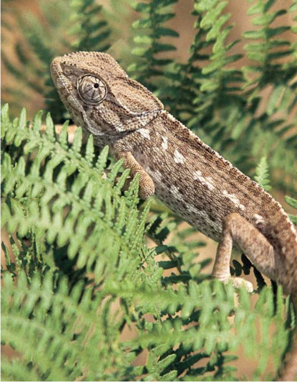
ELEMENTO DE FAUNA.

gar al que se han adaptado se le denomina hábitat .