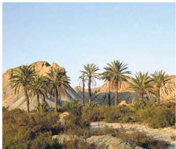
LOS DESIERTOS PRESENTAN UNA BAJA BIODIVERSIDAD.

El término que alude a la variedad de seres vivos diferentes que viven en un territorio determinado se denomina biodiversidad . Este término puede describirse desde el punto de vista de los genes, de las especies y de los ecosistemas.