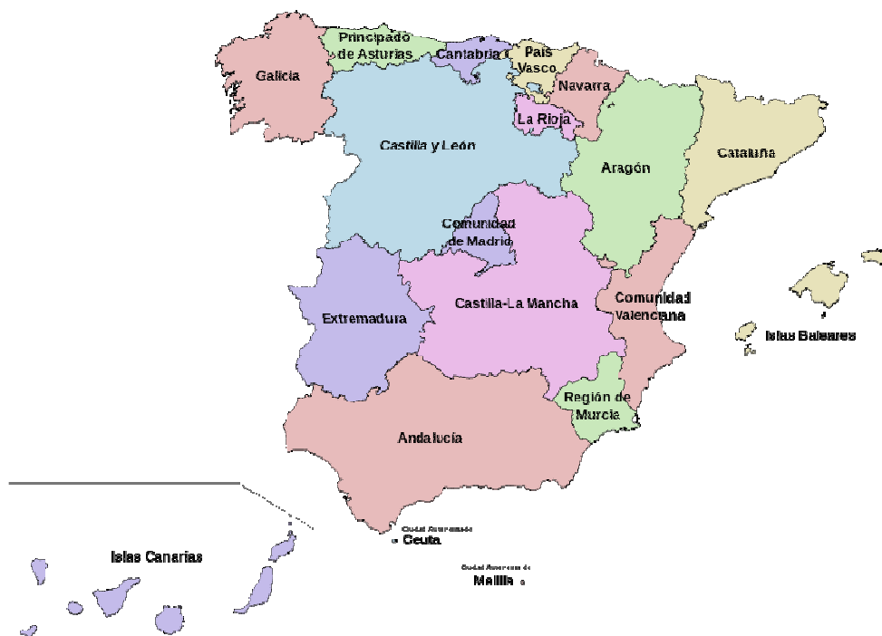
Mapa político de España con las CCAA y Ciudades autónomas

http://rasve.magrama.es/Publica/Agenda/Agenda_buscar.asp