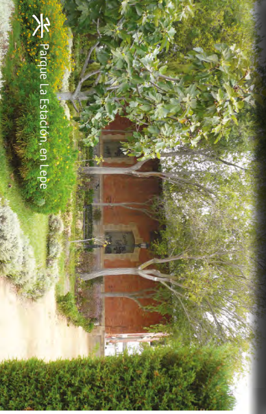
Parque La Estación, en Lepe