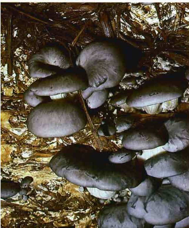
Fig. 11.—Los ejemplares que salen en las superficies verticales, tienen el pie más corto y lateral, y son de mejor calidad.