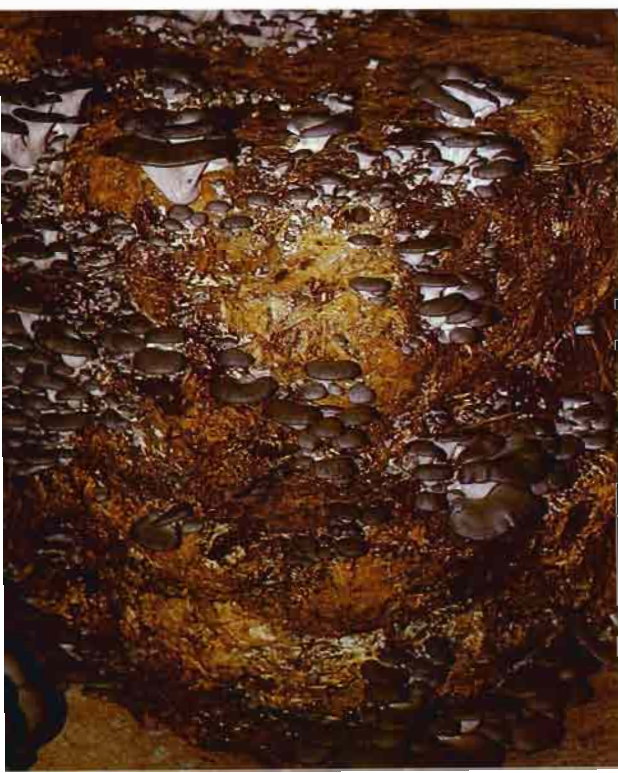
Fig. 7.—Los bloques apilados ahorran mucho espacio y dan buena producción lateral.