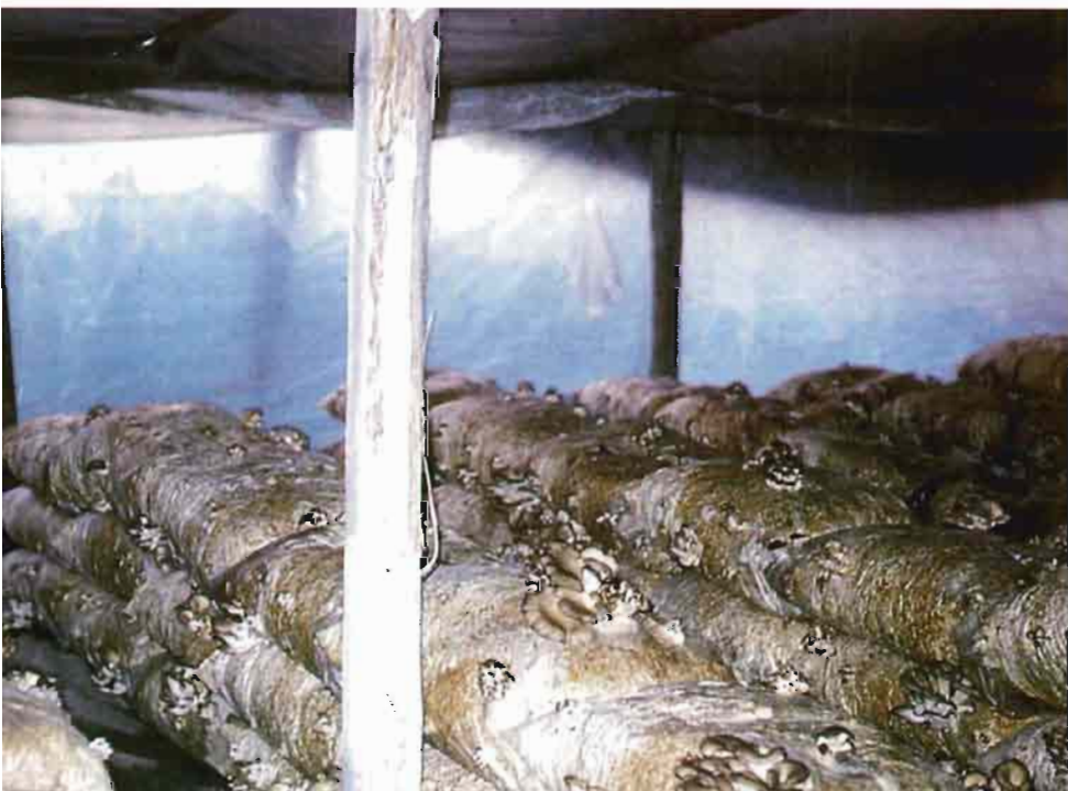
Fig. 3.—El cultivo en invernaderos está limitado a ciertas épocas del año.