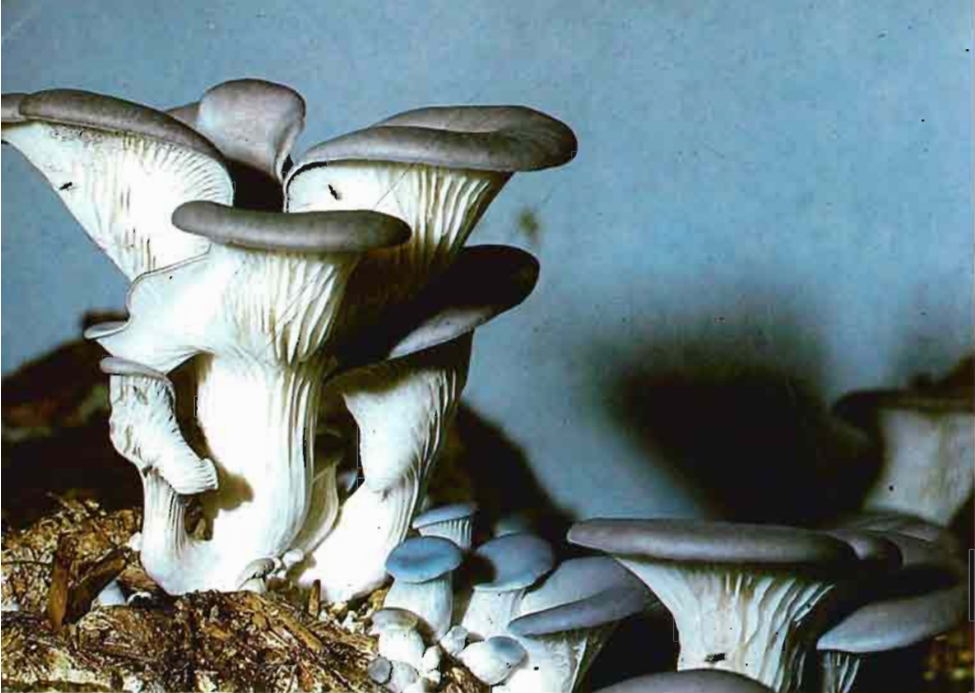
Fig. 10.—Las setas que crecen sobre la superficie horizontal del bloque tienen el pie más largo y el sombrero de peor calidad.