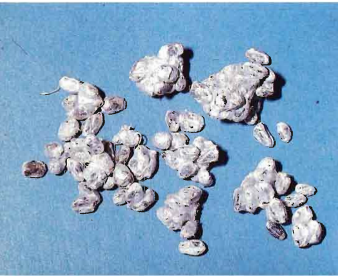
Fig. 4.—El micelio suele comercializarse sobre granos de cereales.

La siembra consiste en mezclar el micelio con la paja o sustrato ya preparado, de un modo uniforme. La cantidad de micelio comercial que se emplea varía del 1 al 4 por 100 del peso húmedo (lo más frecuente es un 2 ó un 3 por 100). Si la cifra es alta, el desarrollo del hongo será más rápido y abundante, pero resultará más caro y la temperatura del sustrato puede subir demasiado y matar al propio micelio.