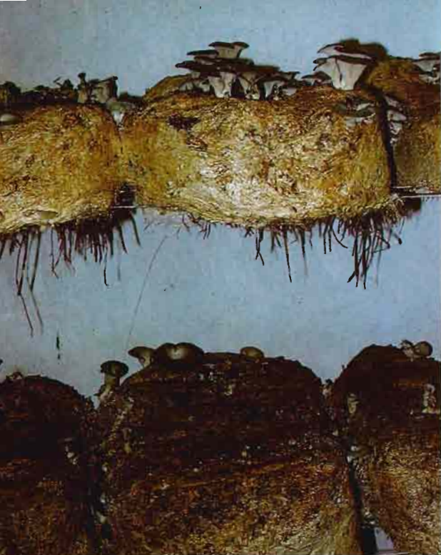
Fig. 6.—Los bloques que se coloquen aislados no deben ser tan bajos como los de la figura. Las superficies verticales deben ser mayores.