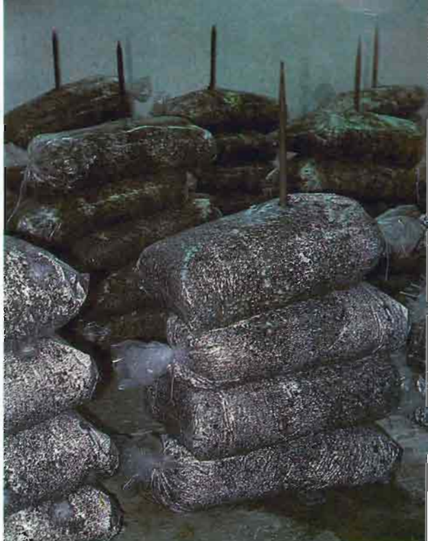
Fig. 9.—Si se emplean sacos perforados, no es preciso quitar el plástico después de la incubación.