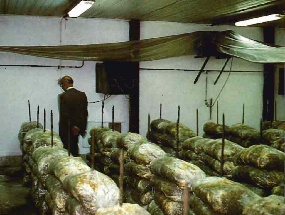
Fig. 2.—En locales cerrados tiene que haber buena ventilación.