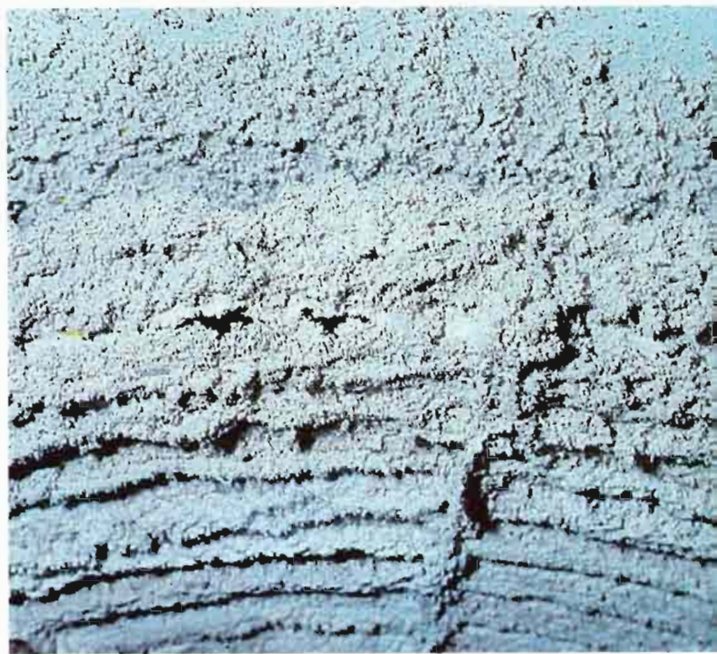
Fig. 12.—El polvillo de esporas se deposita en todas partes y puede atascar los orificios de ventilación.