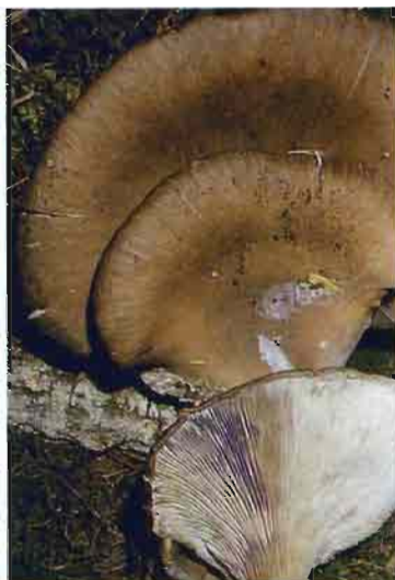
Fig. 1.—El color de la seta depende de la variedad.

En la parte inferior del sombrero hay unas laminillas dispuestas radialmente como las varillas de un paraguas, que van desde el pie o tallo que lo sostiene, hasta el borde de aquél. Están espaciadas unas de otras y son anchas, blancas o crema, a veces bifurcadas, y en ellas se producen las esporas destinadas a la reproducción de la especie. Estas esporas son de tamaño microscópico ( 7,5 a 11,5 \times 3 a 5,6 micras), oblongas, casi cilíndricas. Aunque no se distinguen a simple vista, cuando se depositan en masa forman una especie de polvillo harinoso denominado «esporada», de color blanco con cierto tono lila-grisáceo. La esporada se consigue fácilmente colocando un sombrero (sin pie) en su posición normal sobre un papel oscuro, durante unas horas.