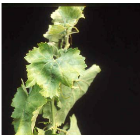
Decoloraciones amarillas en bordes de hojas.

En años de ataques intensos llega a defoliar totalmente las cepas, impidiendo la normal maduración del racimo y agostamiento de los sarmientos.