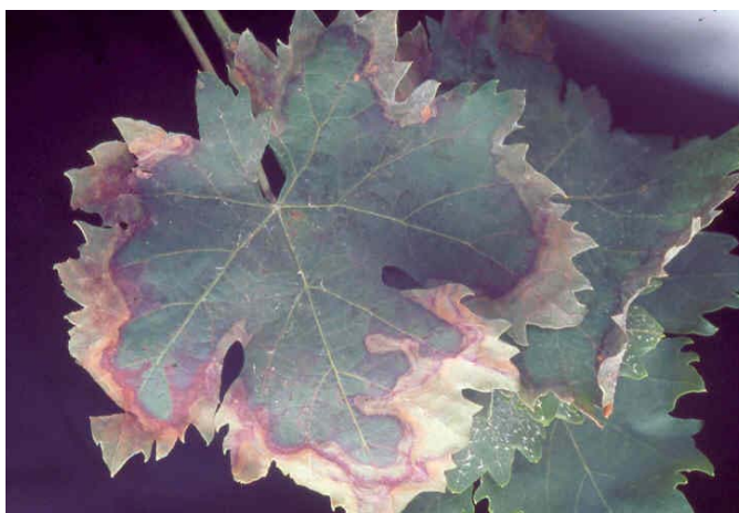
Hoja de variedad tinta con daños de mosquito verde.

Vid, algodón y un gran número de especies silvestres y cultivadas