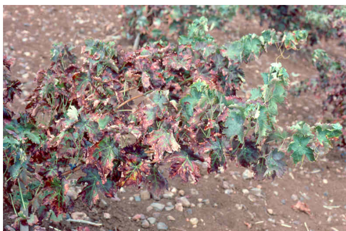
Cepa con fuerte ataque de mosquito verde.