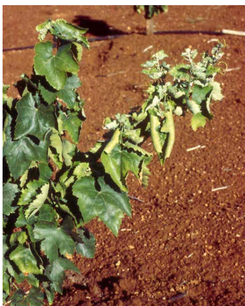
Hojas abarquilladas y brotes anticipados.