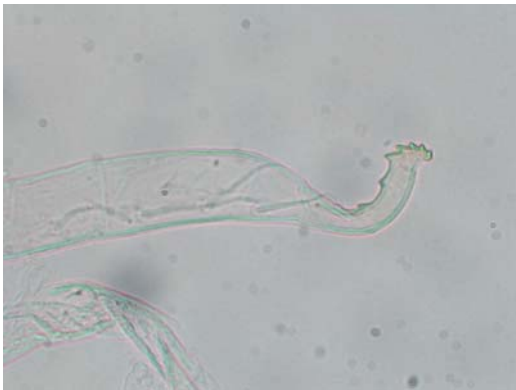
Apéndice de pigóforo de J. lybica

La genitalia tiene el apéndice del pigóforo como una especie de brazo articulado y el estilo a modo de fauce de lobo.