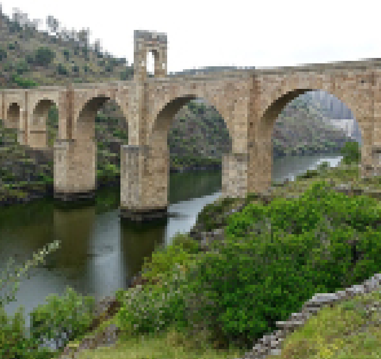
Puente de Alcántara sobre el Tajo

Durante su recorrido el caminante atravesará varias zonas de especial importancia para la protección de la avifauna del entorno y que se ubican en la cuenca del Guadiana. Entre las peculiaridades que hacen