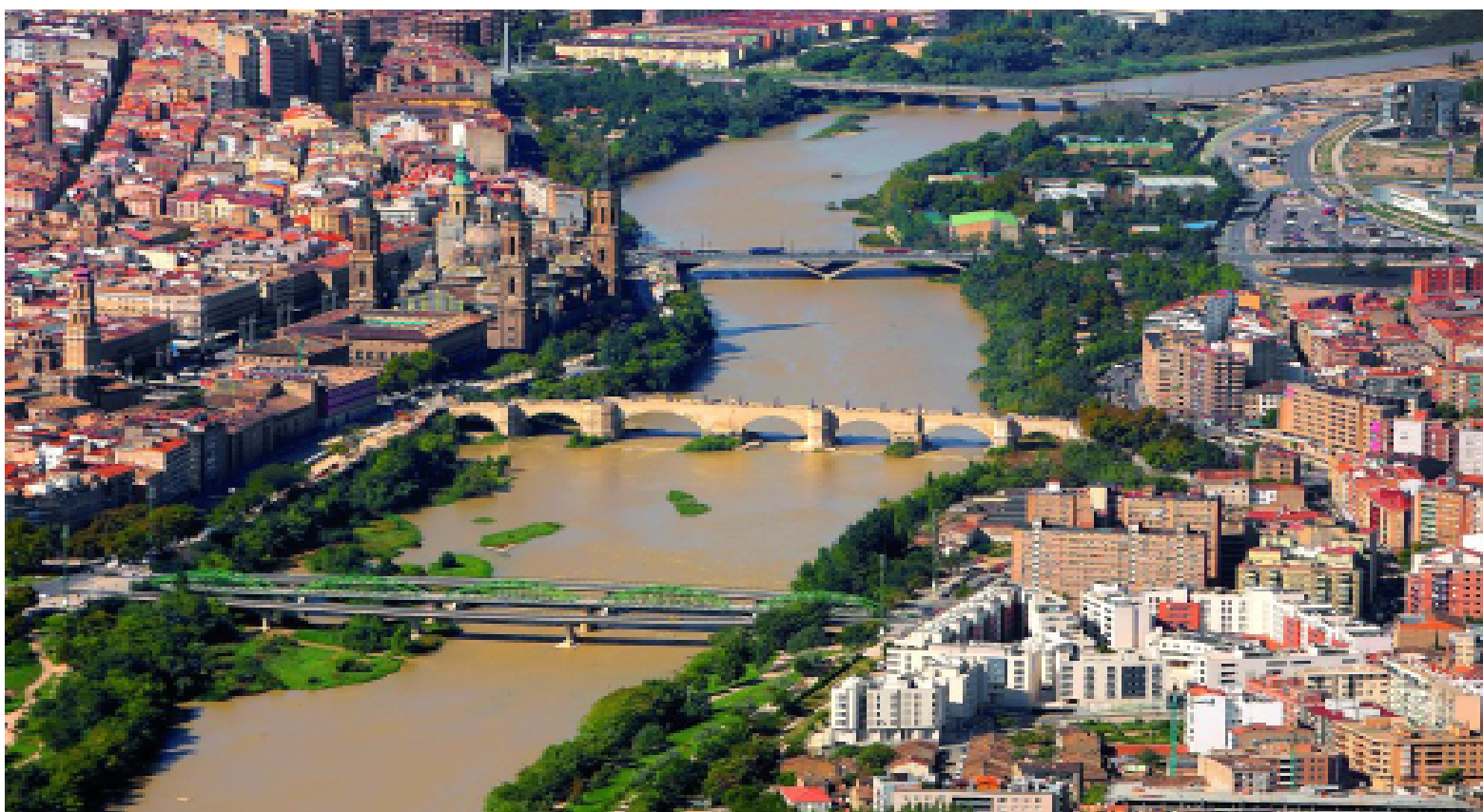
El Ebro a su paso por Zaragoza

El Camino Natural del Ebro GR 99, con sus 1.280 km de recorrido, es la versión actual de todas las vías arcaicas que antaño cruzaron su entorno conectando a sus habitantes y de las que este itinerario ha heredado trazados, rutas, curiosidades y patrimonio cultural e histórico. A lo largo de este trazado se cruzan lugares con un vasto patrimonio cultural e histórico como, por ejemplo, Zaragoza, donde además de conocer sus imponentes monumentos (como el palacio de Larrinaga, el de Sástago o su impresionante puente de piedra sobre el Ebro) es posible visitar la Exposición Internacional, dedicada precisamente al agua y construida en torno al río Ebro a su paso por la capital maña. Son muchos los rincones que merecen una parada obligatoria en este largo camino, otro de ellos es Tudela, en Navarra, un enclave que ha sido habitado desde el Paleolítico inferior, época de la que aún es posible conocer algunos vestigios en esta localidad. Ya en sus últimas etapas este itinerario sumerge al caminante en un entorno natural privilegiado al que se encuentra ligado el patrimonio cultural de la zona como es el caso de las inmediaciones del municipio de Deltebre, donde concluye el trayecto.