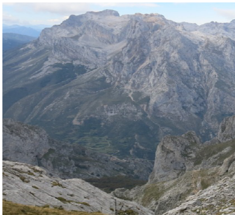
Picos de Europa en el Camino Natural de la cordillera Cantábrica

La mayor parte del recorrido discurre por lugares que se encuentran protegidos, lo que da una idea del vasto patrimonio natural, paisajístico y ecológico