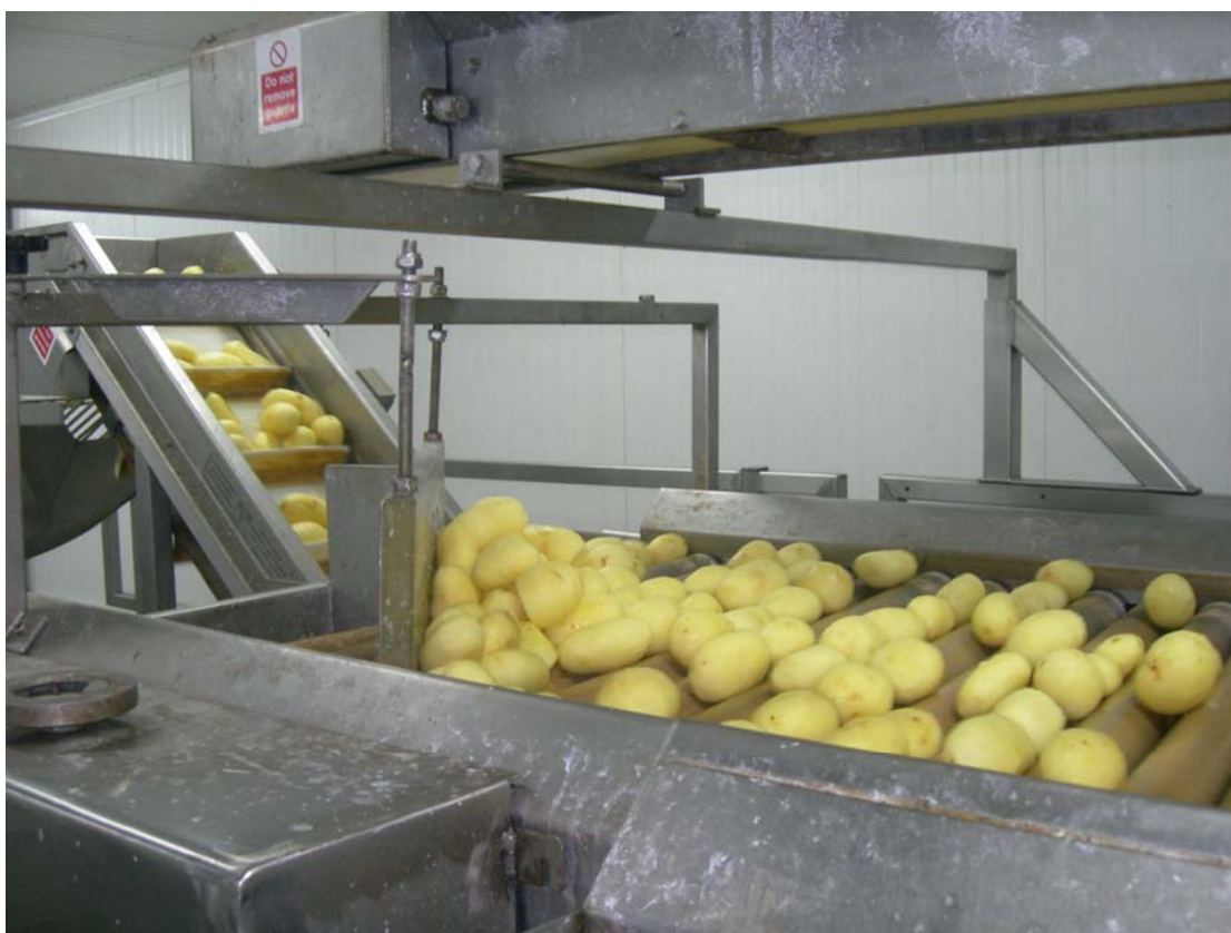
Instalación línea de pelado y envase de patata en central hortofrutícola. Mallorca