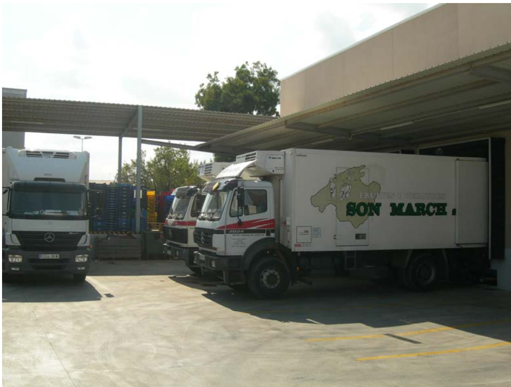
Traslado, ampliación y mejoras tecnológicas de planta de manipulación y comercialización de productos hortofrutícolas de industria agroalimentaria. Mallorca