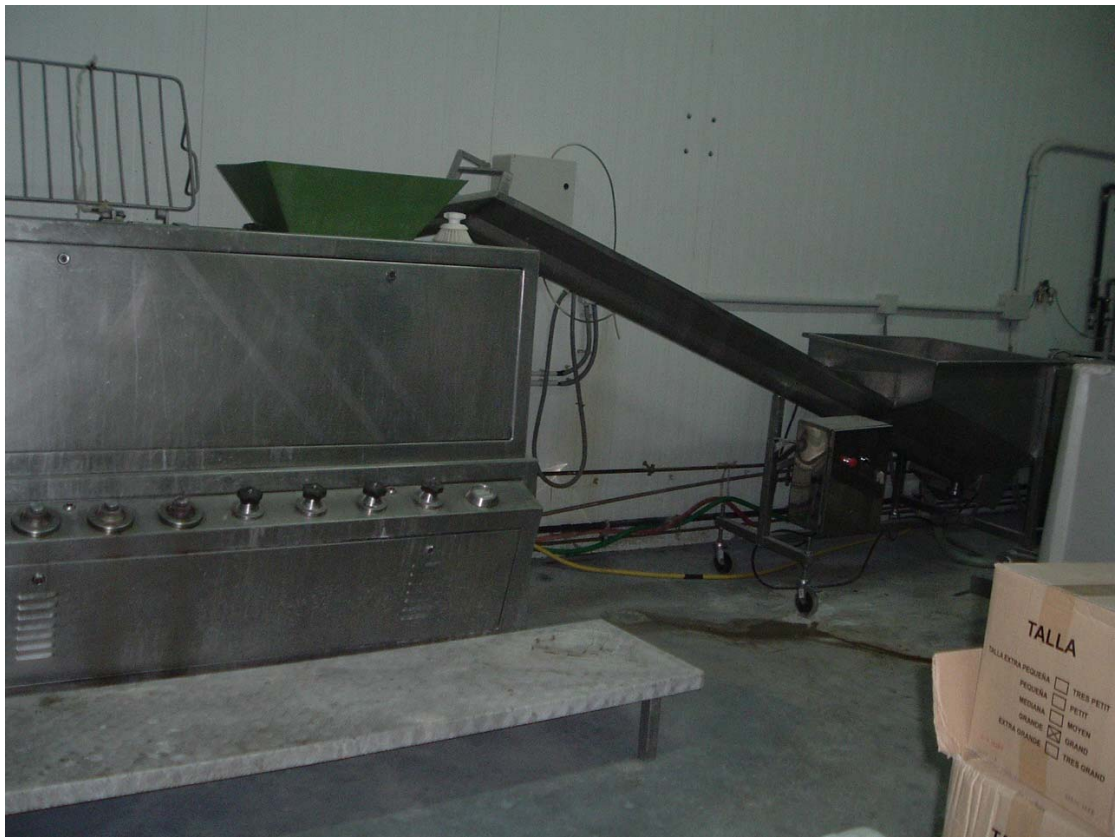
Máquina hiladora-dosificadora mdo. Combi 700 completa con rulo 80 gr. y silano. Menorca