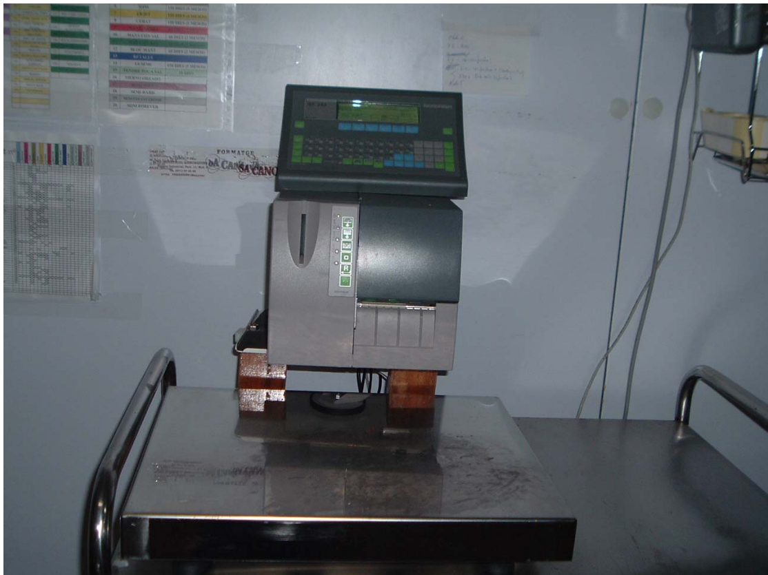
Instalaciones y equipos de transformación. Proyecto de inversiones IV (ampliación de quesería). Menorca