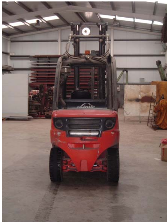
Inversión en mejora y perfeccionamiento. Modificación industria unifeed. Menorca