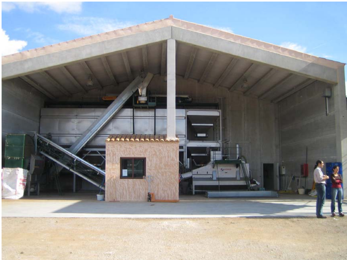
Mejora transformación y comercialización productos agrarios. Proyecto de instalación almazara. Mallorca