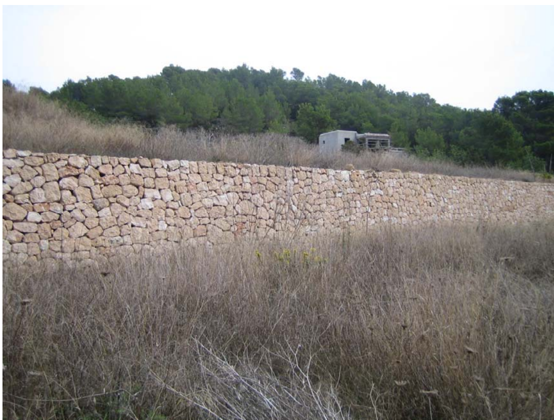
Rehabilitación y acondicionamiento de muros de contención de bancales para evitar la erosión y permitir el cultivo. Eivissa y Formentera