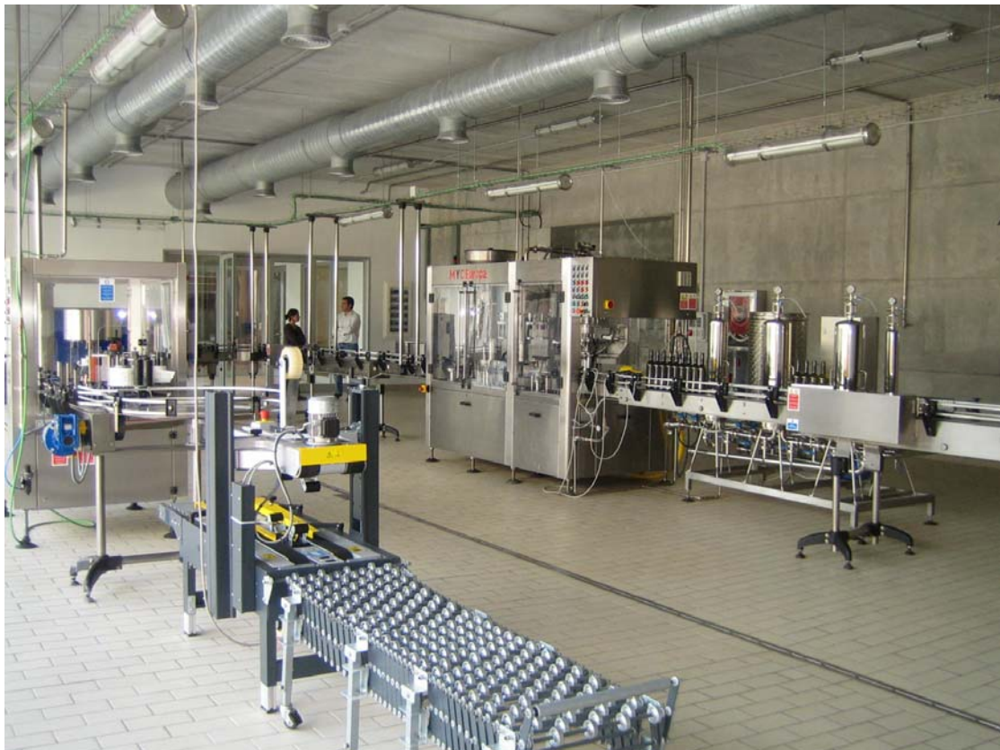
Construcción e instalación de bodega. Mallorca