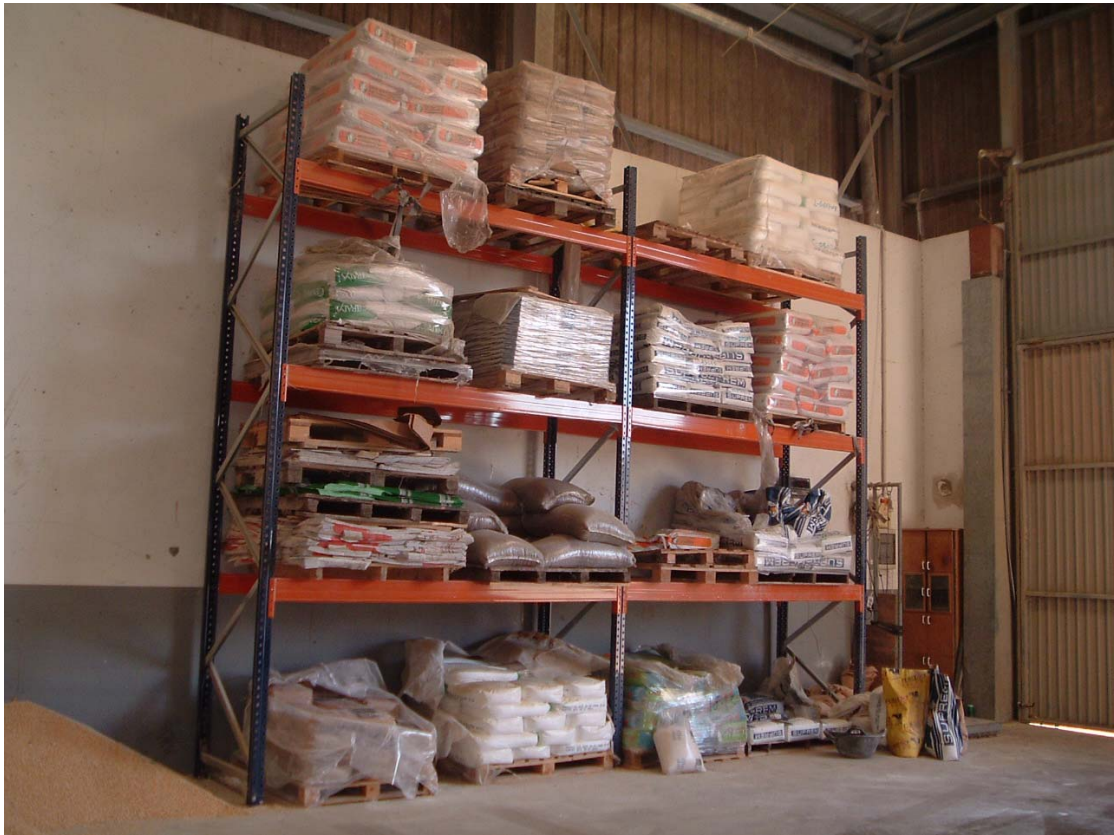
Instalaciones y equipos. Adquisición de equipos. Menorca