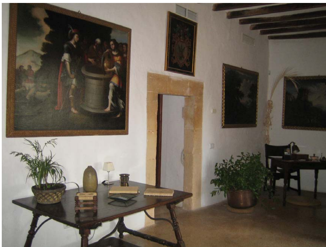
Agroturismo y oferta complementaria en el ámbito rural. Rehabilitación de la finca: dormitorios, baño y piscina. Mallorca