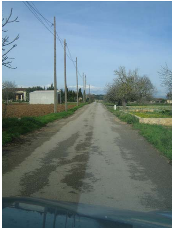
Mejora de caminos rurales de titularidad municipal. Mallorca