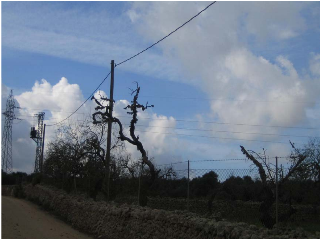
Electrificación rural. Suministro MT y ET. Mallorca