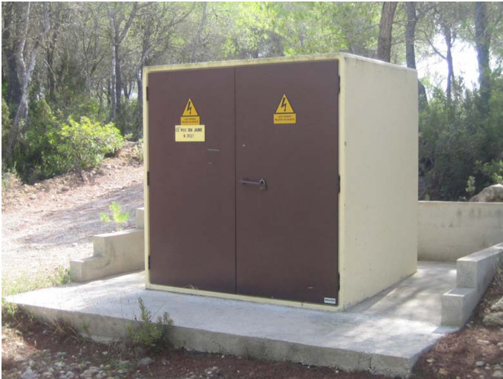
Electrificación rural. Línea de MT subterránea y centro de transformación rural y red de BT subterránea. Eivissa y Formentera