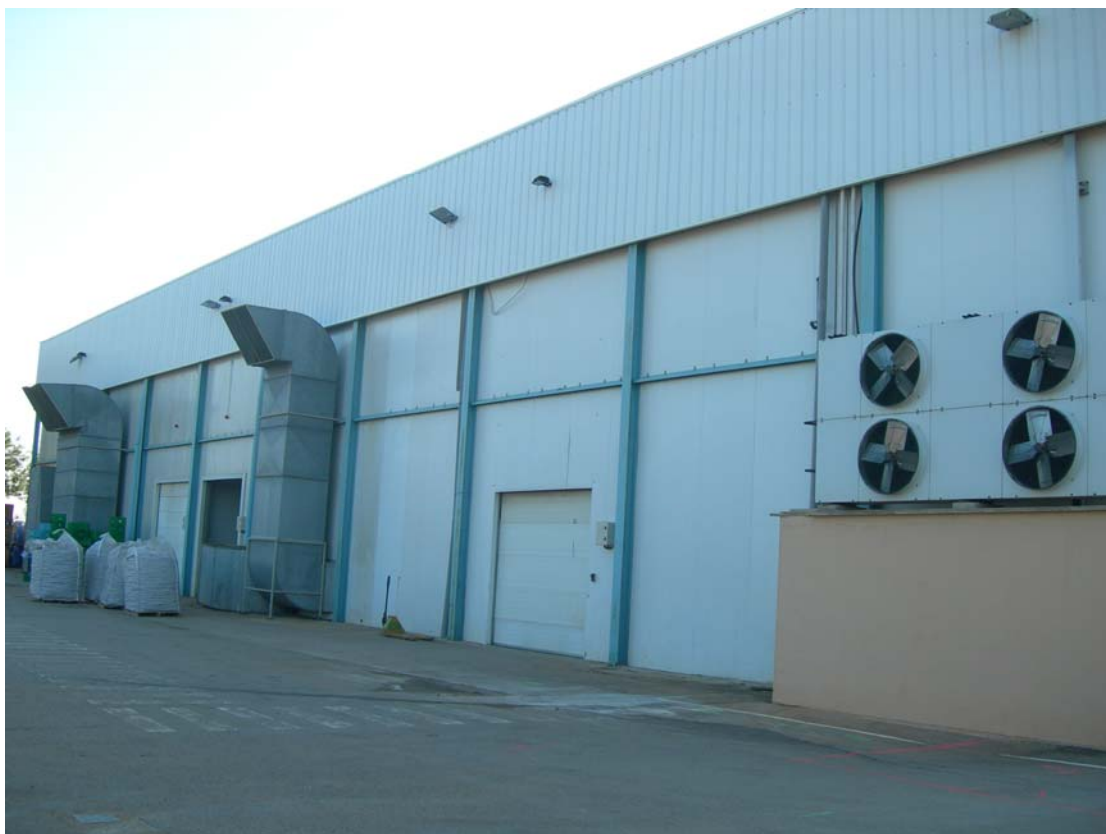
Instalación de cámaras frigoríficas. Mallorca