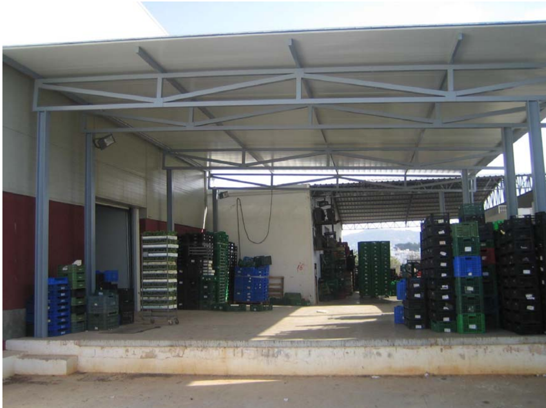
Centro de distribución y concentración productos agrícolas locales. Eivissa y Formentera