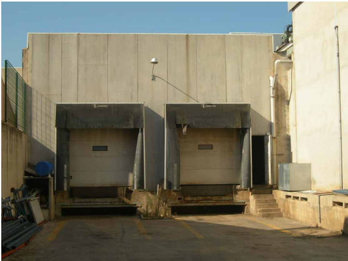
Instalación línea cítricos; dos cámaras frigoríficas; una cámara unida; cebollas. Mallorca