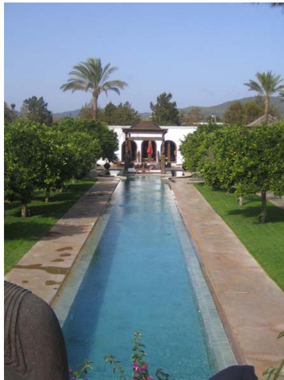
Agroturismo y oferta complementaria en el ámbito rural. Eivissa y Formentera