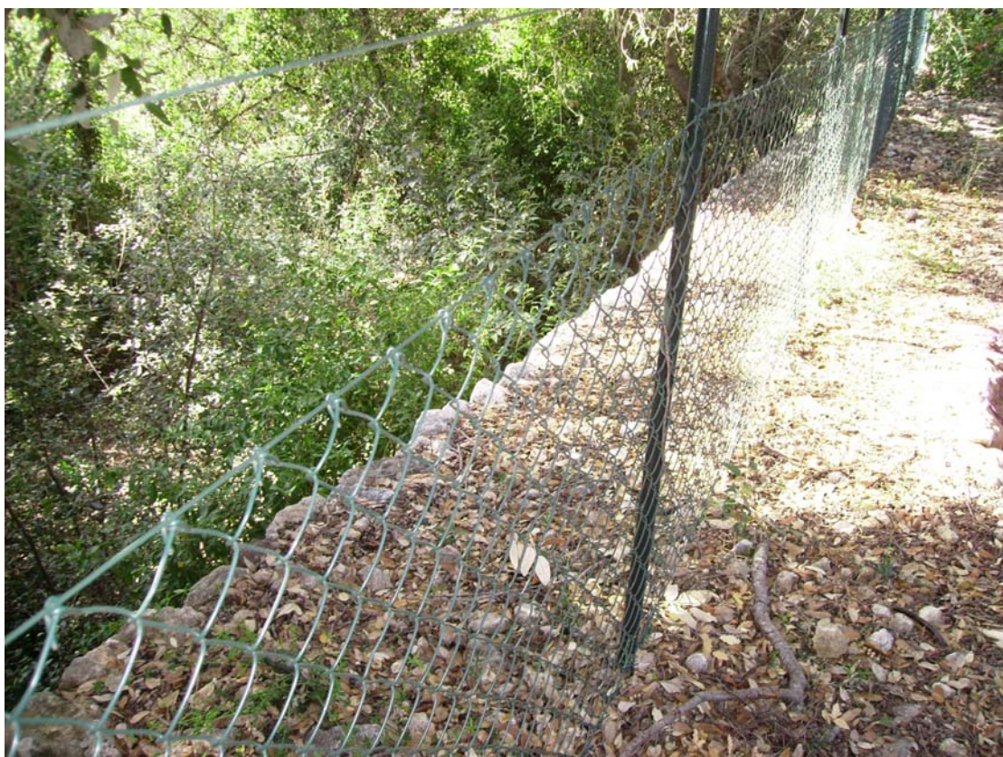
Rehabilitación y acondicionamiento de paredes secas de separación de parcelas. Mallorca