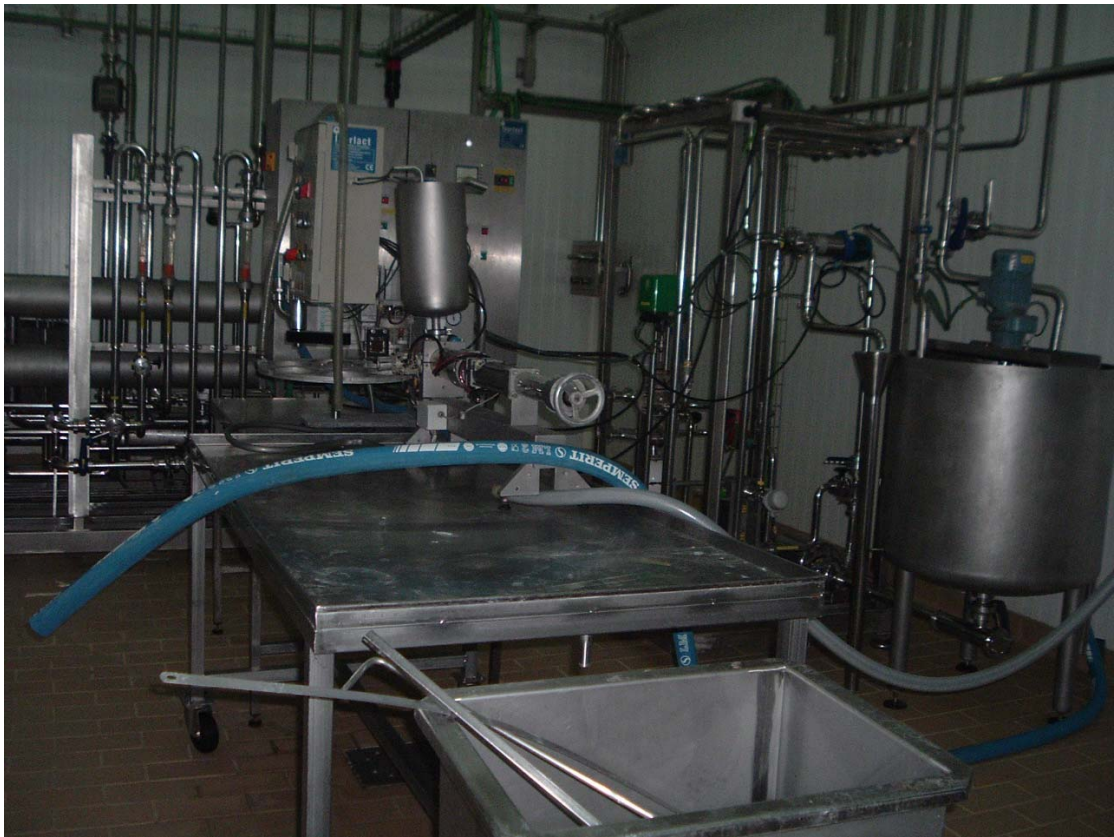
Mejora y perfeccionamiento de una industria láctea (quesería). Menorca