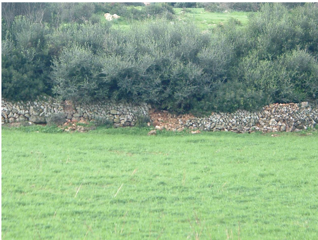
Rehabilitación de paredes secas de piedra, separación de parcelas. Menorca