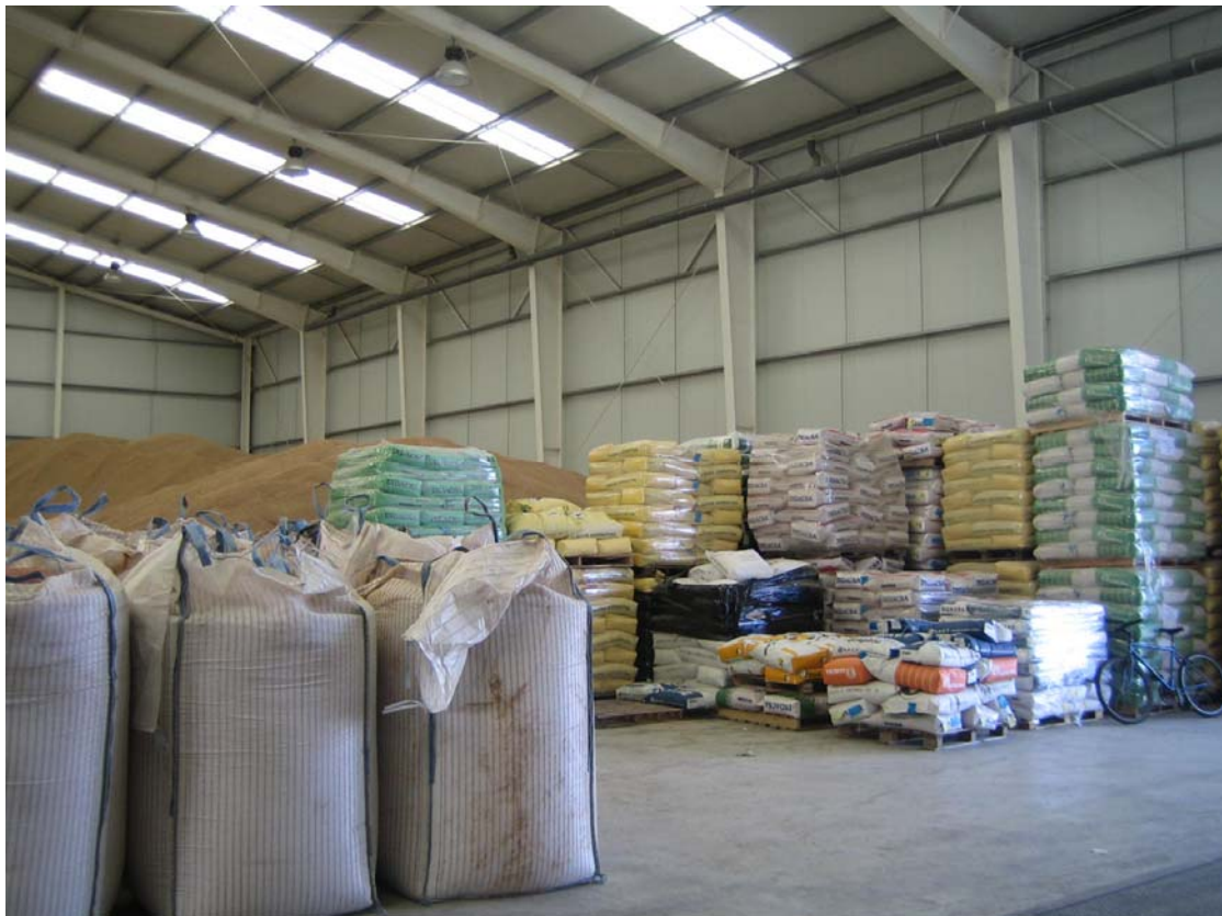
Traslado y acondicionamiento industria agroalimentaria. Mallorca