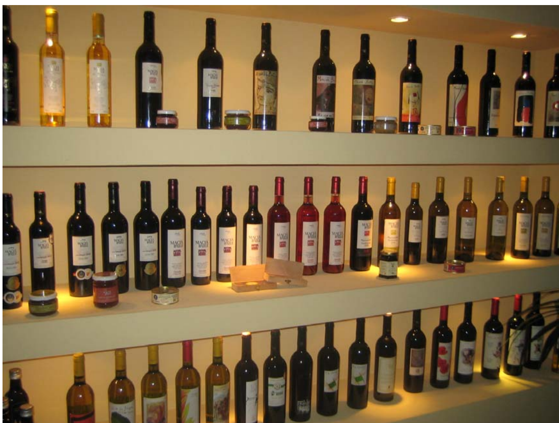
Artesanía y embotellado de vino. Ampliación de instalaciones de bodega. Mallorca