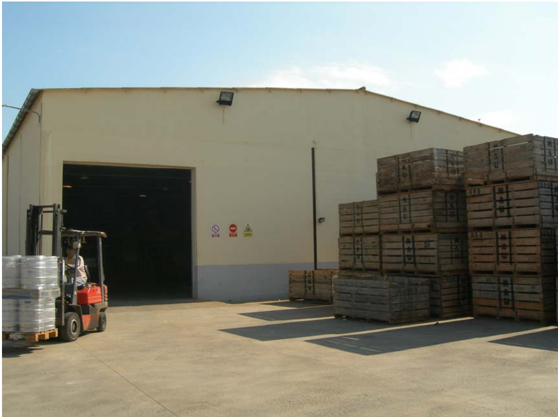
Instalaciones y equipos. Adquisición de maquinaria agrícola. Mallorca