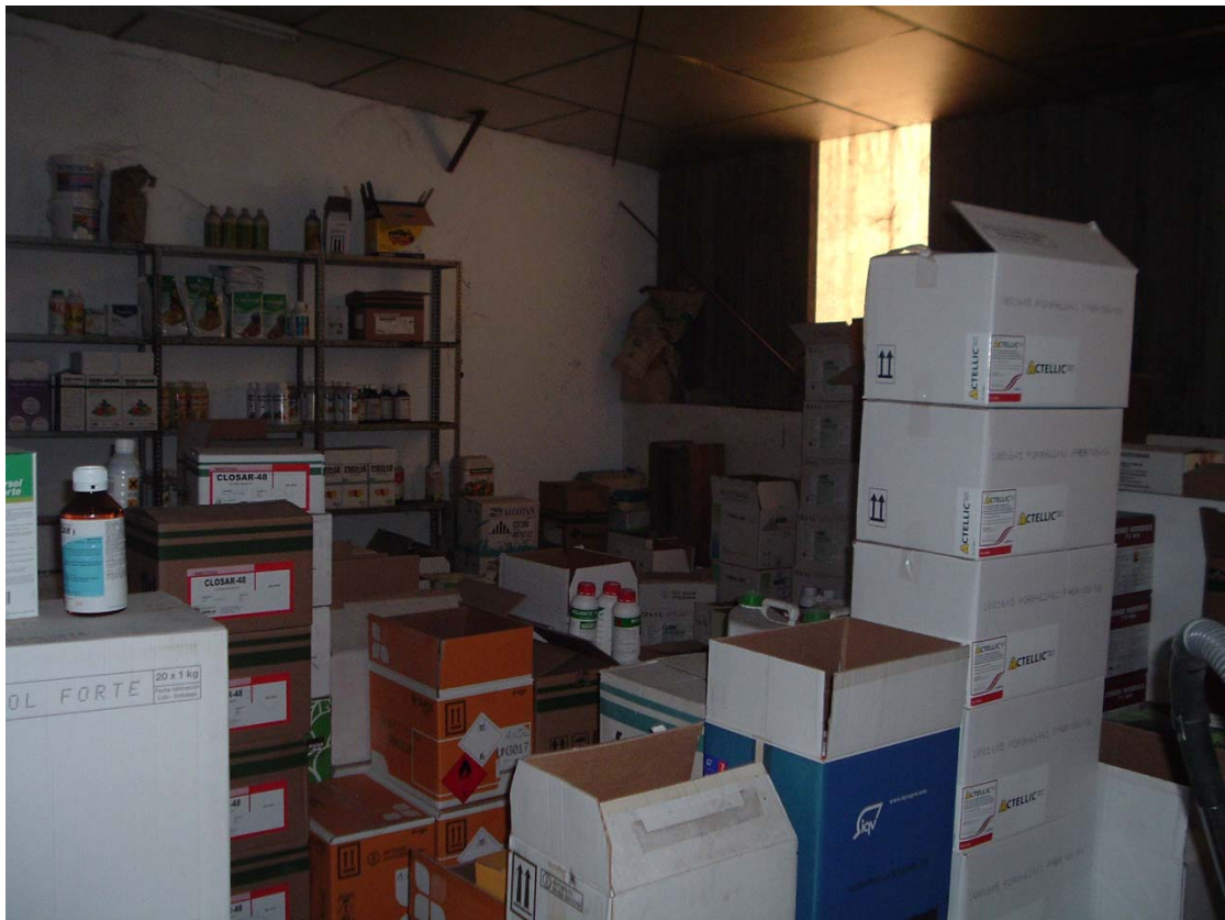
Mejora y modernización en la gestión y control del almacén. Menorca