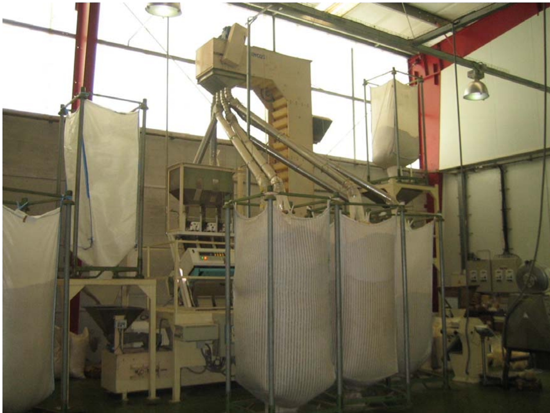
Traslado actividad almacén y transformación almendras y frutos secos. Mallorca