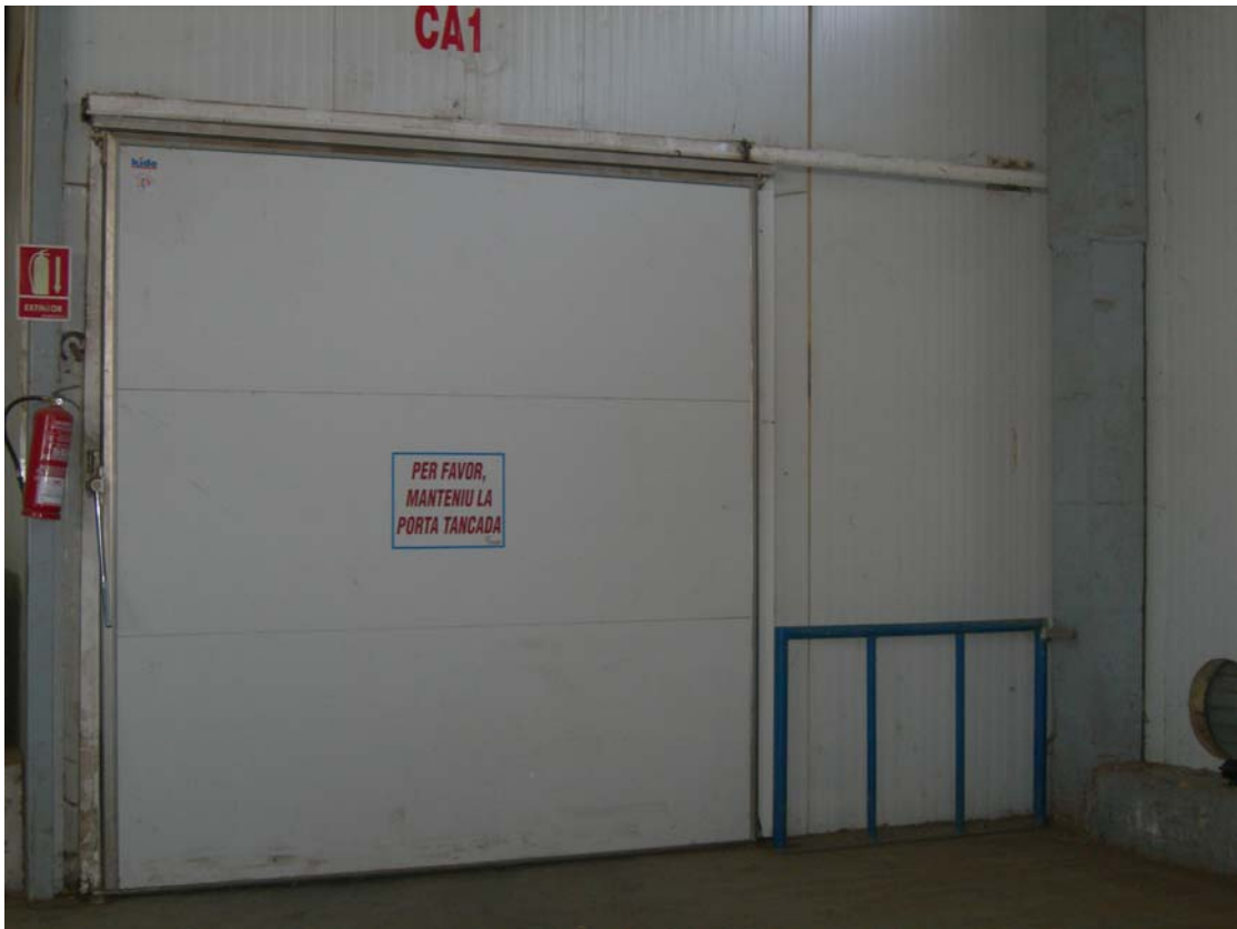
Planta clasificación y envase de patatas y cebollas. Mallorca