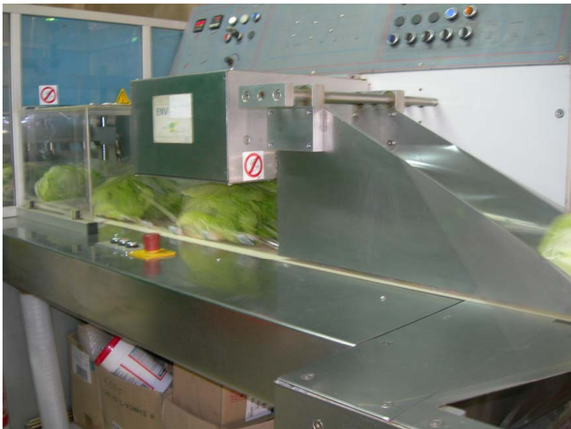
Maquinaria envasadora y etiquetadora y mesa giratoria. Mallorca