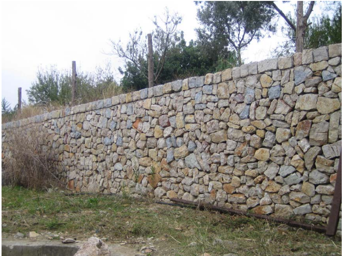
Rehabilitación de muros y paredes secas de piedra, de separación de parcelas. Mallorca