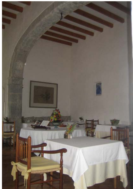
Agroturismo y oferta complementaria en el ámbito rural. Mallorca