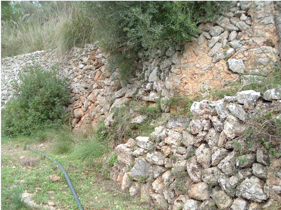
Rehabilitación de muros de contención de bancales y rehabilitación de paredes secas. Menorca