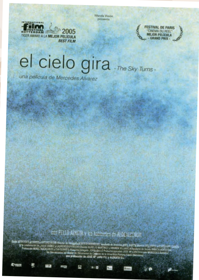
EL CIELO GIRA (2004), de Mercedes Álvarez. Una reflexión profundamente cinematográfica sobre la soledad de la España despoblada de los páramos de Soria.