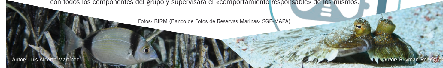
Autor: Luis Alberto Martínez

Fomentar el conocimiento: características medioambientales y particulares de la inmersión: descripción, normas de seguridad y planificación de la inmersión.