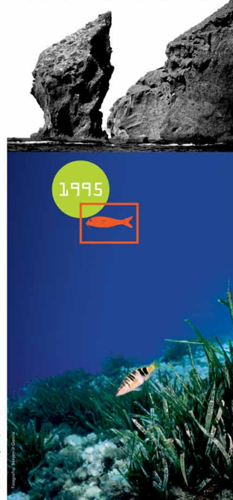
Diseño: Sandra Figuerola y Marina Gallén