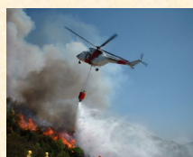
Extinción de un incendio en Quiroga.