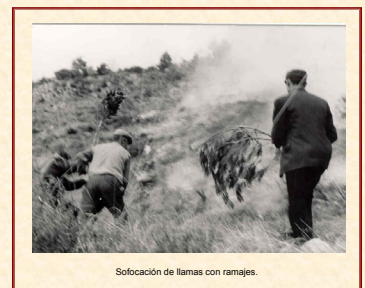
Sofocación de llamas con ramajes.