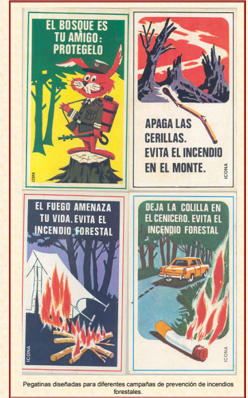
Pegatinas diseñadas para diferentes campañas de prevención de incendios forestales.