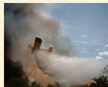
Extinción de un incendio en Patón. Madrid.