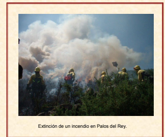
Extinción de un incendio en Palos del Rey.