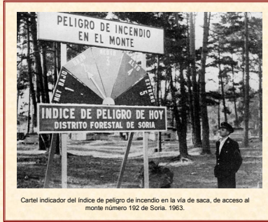
Cartel indicador del índice de peligro de incendio en la vía de saca, de acceso al monte número 192 de Soria. 1963.