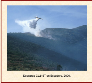
Descarga CL215T en Escudero. 2000.