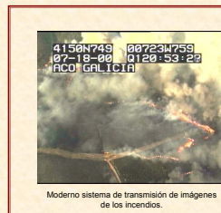
Moderno sistema de transmisión de imágenes de los incendios.