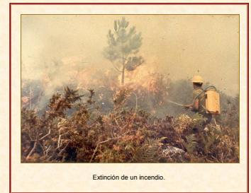
Extinción de un incendio.