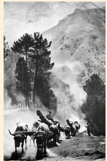
Transportes forestales de España. (Sierra de Segura). 1916.