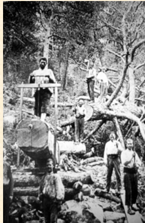
Labra y aserrado de la madera en el monte. Jaén. 1930.