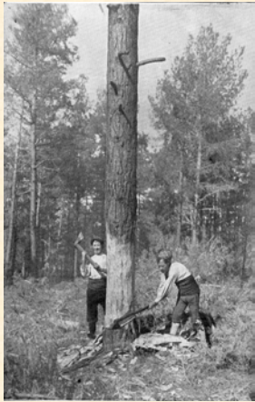
Apeo de buen ejemplar de pino laricio en monte público en Sierra de Cuenca. (Explotaciones forestales de H. Echevarría). 1925