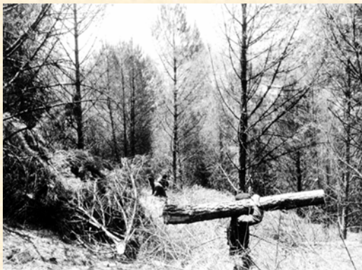
Extracción de madera a mano. Andújar. Jaén. 1970. Pedro Cortijo.