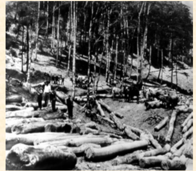
Explotación importante de un hayedo. Navarra.