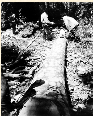
Mediciones tras el descortezado de un fuste. San Juan de la Peña. Huesca. 1962.

El hombre ha utilizado la madera del bosque desde tiempo inmemorial. Sólo ha cambiado a lo largo del tiempo, el uso que en cada momento hace de ella. Los antiguos y penosos sistemas de aprovechamiento manual y transporte indican lo valioso que este recurso ha sido siempre para el desarrollo humano. El aumento de la demanda y la gran capacidad de extracción de los actuales métodos de aprovechamiento, obligan hoy más que nunca, a ordenar este aprovechamiento para garantizar la sostenibilidad del mismo.