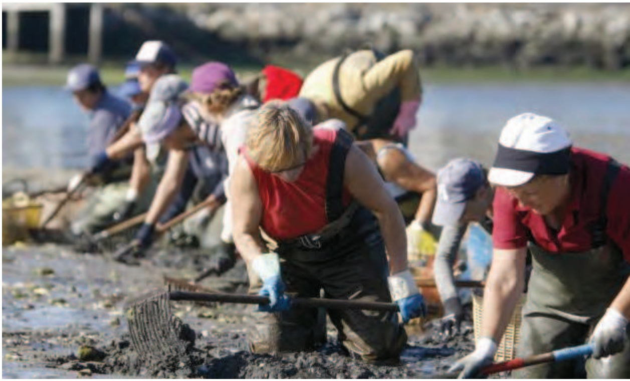
Mariscadoras trabajando expuestas al sol.

Mujeres vinculadas a la pesca y a la acuicultura se reunirán en las jornadas.