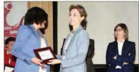
Diversos momentos del homenaje a las mujeres del sector pesquero. ROMAN ALONSO