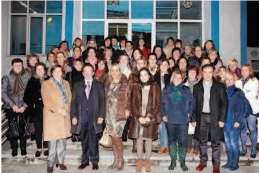
La consejera de Pesca posa en la Escuela de Formación Náutico Pesquera junto con las rederas que han tramitado su acreditación profesional

La consejera de Pesca cree que es una excelente oportunidad para reconocer el papel de "heroínas anónimas que, poco a poco, van viendo al fin cómo se abren paso sus derechos"