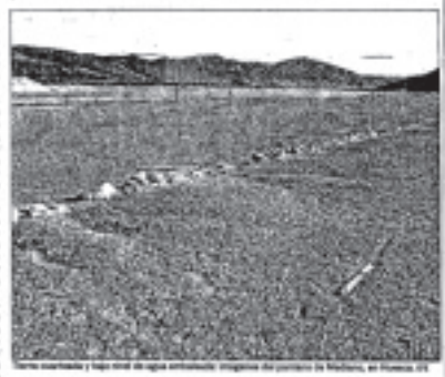
Las zonas más afectadas por la sequía...

El Gobierno ha fijado indemnizaciones por daños en 170 millones de euros, reducciones y exenciones fiscales y créditos bonificados para el sector" (...).