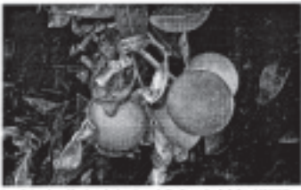
Las frutas han sido el producto más perjudicado por las heladas.

La exportación española de frutas y hortalizas en el primer trimestre de 2005 comparada con el mismo periodo de 2004, cayó un 13% en volumen y se estancó en valor (+1%), totalizando 2,6 millones Tm y 2.411 millones de euros, lo que se debe, según Fepex, a los efectos de las heladas. La exportación de frutas cayó un 13% en volumen y un 8% en valor, totalizando 1,3 millones Tm y 1.020 millones de euros. Los cítricos fueron el producto más perjudicado con un descenso del 12% en volumen y valor, totalizando 1,2 millones Tm y 779 millones de euros" (...).