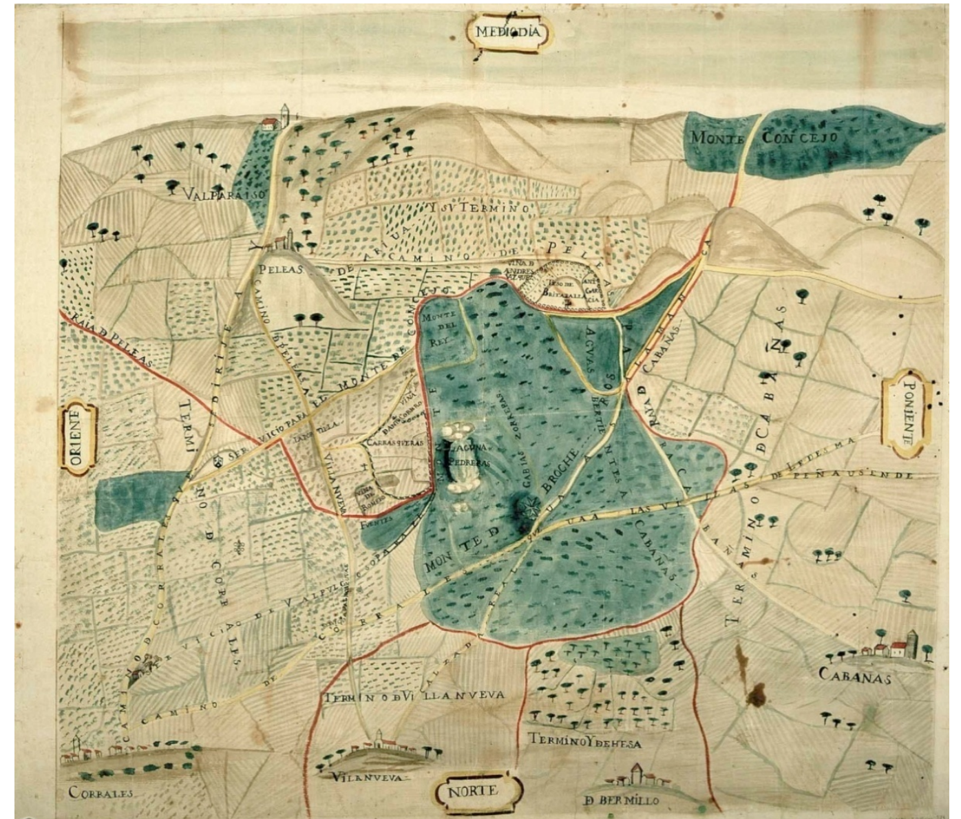
MAPA DE LOS TÉRMINOS SITUADOS ENTRE PELEAS DE ARRIBA, VILLANUEVA DE CAMPEÁN Y CABAÑAS DE SAYAGO (ZAMORA)

La unidad de esa estructura profunda que llega a articular lo minúsculo con la metrópolis, reside en las características de la celda elemental o unidad habitacional como territorio interior o privativo, que en combinación con otras celdas genera ámbitos superiores de complejidad.