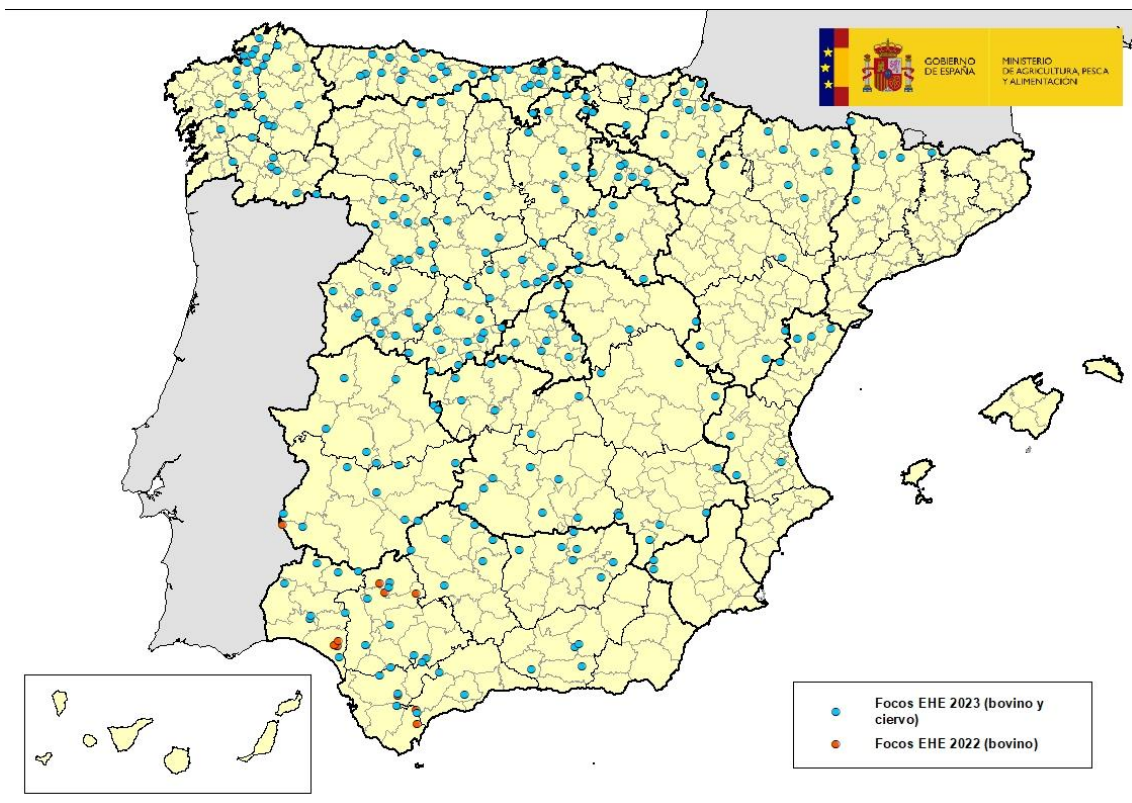
Mapa 1: Comarcas afectadas por EHE en España en años 2022 y 2023

Desde la última actualización sobre la enfermedad realizada el pasado 22 de noviembre, el Laboratorio Central de Veterinaria (LCV) de Algete, laboratorio nacional de referencia para esta enfermedad, ha confirmado casos de enfermedad hemorrágica epizootica (EHE) en 6 nuevas comarcas. De ellos, 5 se han detectado en explotaciones de bovino en las comarcas de: Almazán (Soria); Calahorra (La Rioja); La Plana de Vinarós (Valencia); Carmona (Los Arcos) (Sevilla) y Cangas del Narcea (Asturias). Asimismo, se ha detectado 1 caso en cabra montés en la comarca de Mora de Rubielos (Teruel). Ver mapa 1.