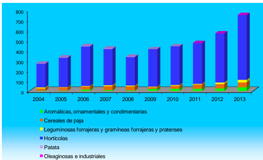
Gráfico 2. Evolución de la Base de Datos de Semillas y Patatas de Siembra obtenidas mediante el método de producción ecológica, gestionada por el MAGRAMA. Período 2004 – 2013.

En el Gráfico 2, se muestra la evolución que han experimentado los registros de la Base de Datos de Semillas y Patatas de Siembra de producción ecológica, en el período 2004–2013.