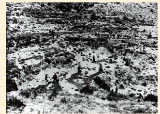
Vista de la zona de Los Majanos, donde se llevan a cabo preparaciones de suelo y plantaciones. Castellón. 1960.