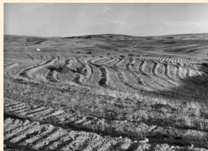
Siembra de Pinus pinaster en fajas. Anchuela del Pedregal. Guadalejara. 1957. Cruzado.