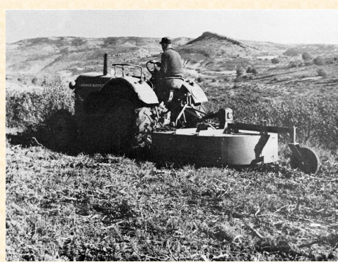
Desbrozadora Brillant actuando sobre un jaral del monte número 80, de la Sierra de Valdececa. Cuenca. 1966.

En estas circunstancias es necesario intervenir para recuperar las condiciones que hagan posible la instalación y desarrollo de una cubierta forestal más eficiente (Preparación del terreno). Cuando la cubierta ha desaparecido por completo la intervención nunca es cuestionable. Sólo los métodos pueden serlo.