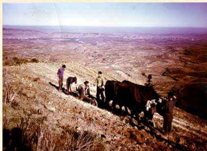
Preparación de suelo con buyes en La Marañosa. Madrid.