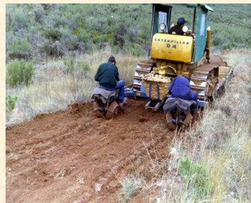
Plantación con máquinas en segunda repoblación en el monte El Cajal. Autol. La Rioja. Sebastián Soto García.