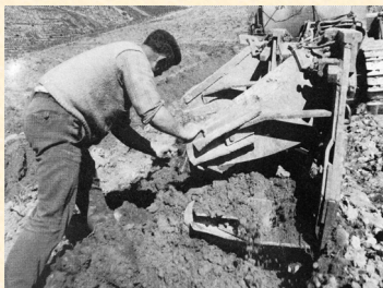
Detalle de una plantación simultánea entre las dos vertederas de un arado bisurco reversible. 1975.

El hombre, en su lucha por la supervivencia primero y tal vez por codicia después, ha ido destruyendo el medio natural que le rodea.