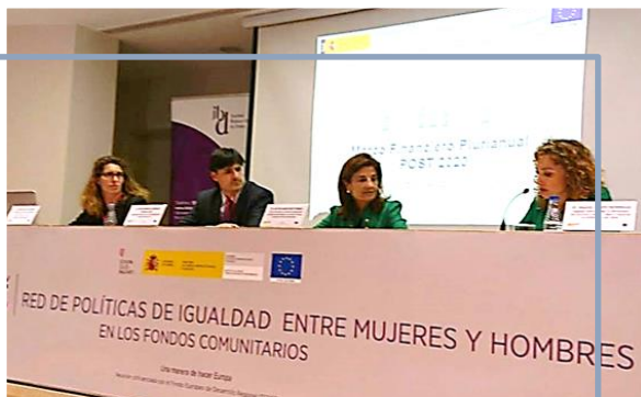
2018: 13 y 14 de abril, Mallorca

En ambos plenarios se expuso la situación del seguimiento de la igualdad en el P. O. del FEMP