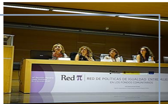
2017: 26 y 27 de octubre, Cáceres