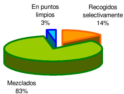
GRÁFICO: Distribución de la cantidad de residuos urbanos según modalidad. Año 2008