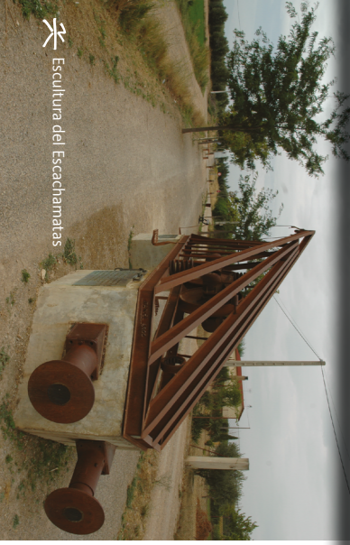
Escultura del Escachamatas