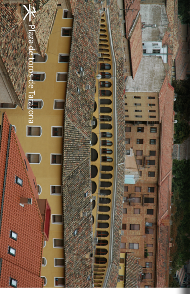
Plaza de toros de Tarazona