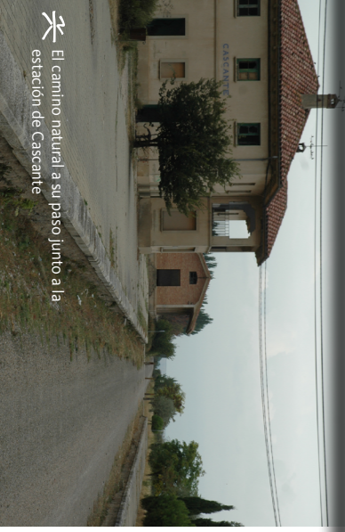
El camino natural a su paso junto a la estación de Cascante