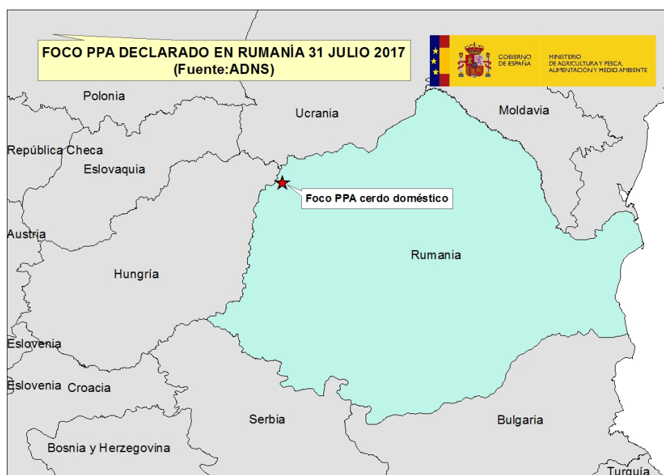
Mapa 1. Foco Rumanía 31 julio 2017

A continuación se incluye un mapa con la localización del foco declarado.